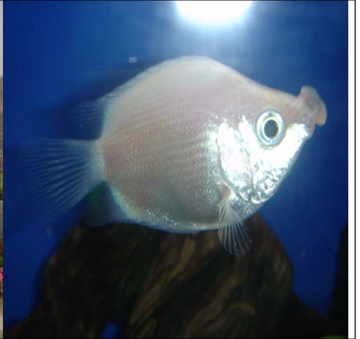
上海水族馆 Kissing 鱼