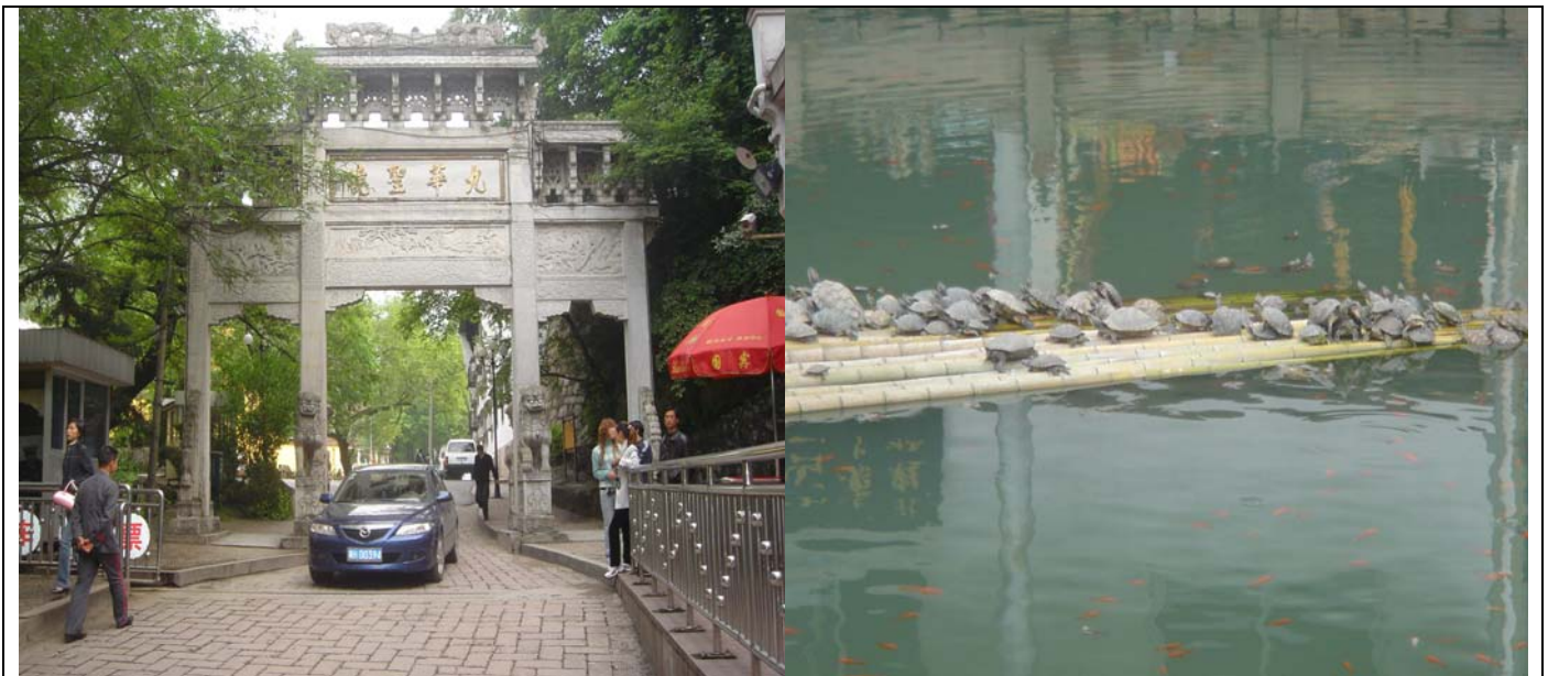
九华山被放生的生灵