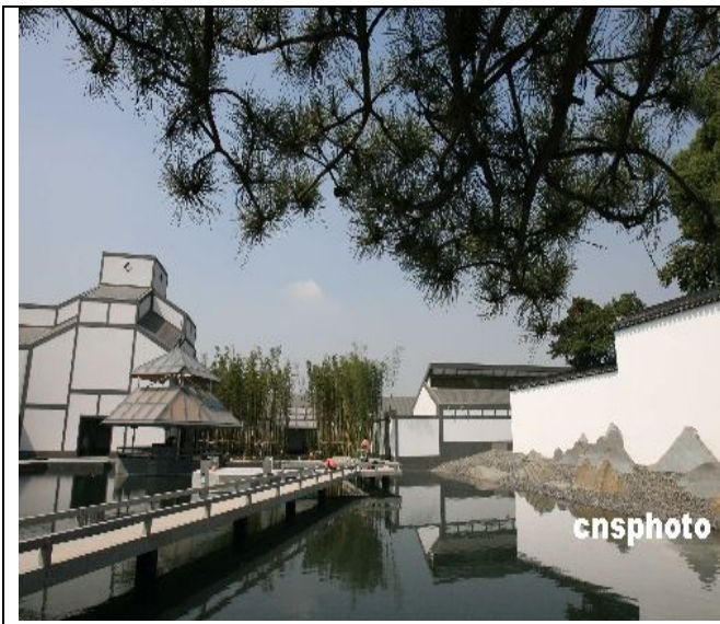
贝聿铭的小女儿--苏州博物馆新馆