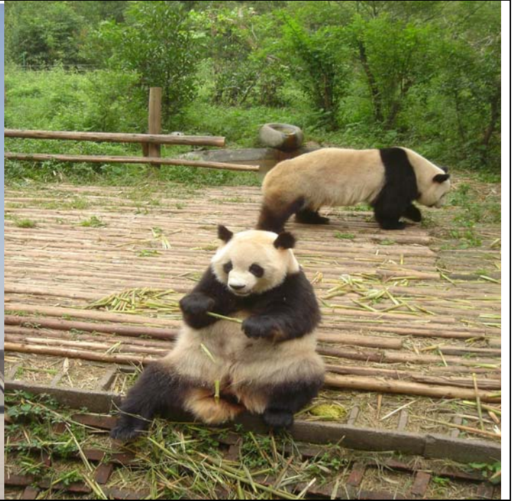
四川金沙熊猫基地